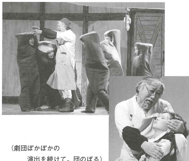
(劇団ぽかぽかの 演出を続けて。団のぼる)

稽古回数は50回を超える。週二回の夜と休日の一。乳飲み子や幼稚園組もいて稽古場は賑やか。子どもたちの成長は大人には大いに刺激となる。格安の入場料は前売500円で日時指定。宣伝用のチラシ、チケットはすべて楽しい手作り。演出は稽古場の雰囲気作りから俳優たちが身体を動かし声を出すところにも注意を向け、大勢の観客に囲まれて舞台の幕を開ける大切さを説きながら付き合うことになる。